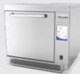
Merrychef high speed oven