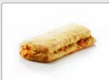
easySandwich m. kylling