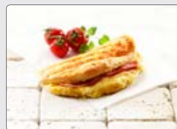
Luna m. skinke & ost