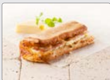
easySandwich m. skinke & mozzarella